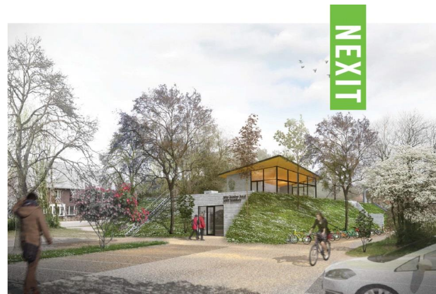
Impressie nieuwe situatie Bunker Saksen Weimar

vanwege de dikke muren uitstekend als repetitiecentrum voor muzikanten. SLAK zou de bunker van de gemeente kunnen aankopen. De investeringen voor de verbouwing zijn fors maar goed terug te verdienen met verhuur.