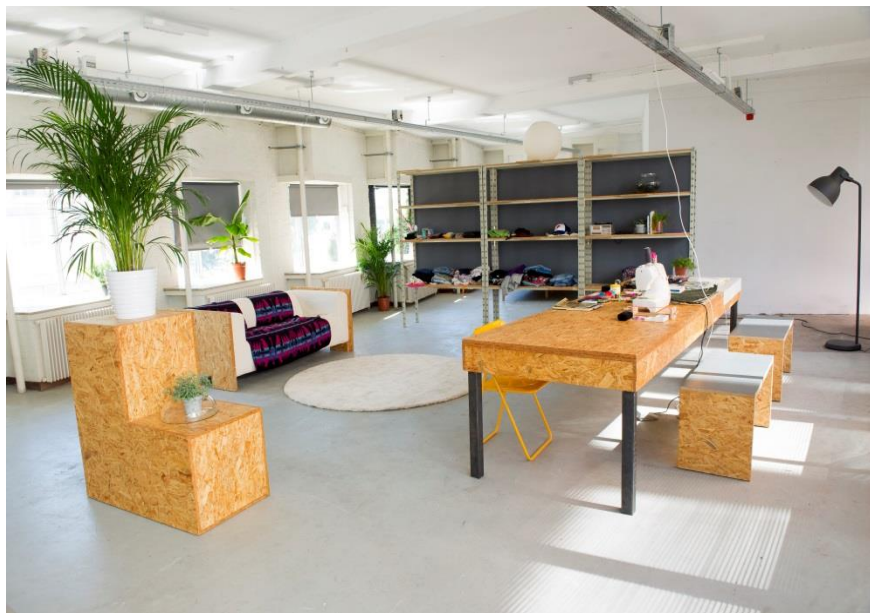
Artist in Residence-studio

Het pand bevindt zich middenin de culturele corridor van Arnhem en leent zich daarom zeer goed als locatie om verbindingen aan te gaan met andere culturele partijen. Zeker gezien het feit dat Circa...Dit de huur van de projectruimten op de benedenverdieping heeft opgezegd. Er is nu ruimte voor een nieuw initiatief of projecten. SLAK voert hierover gesprekken met ArtEZ en hoopt in 2018 een interessante invulling te kunnen vinden, in combinatie met de AIR.