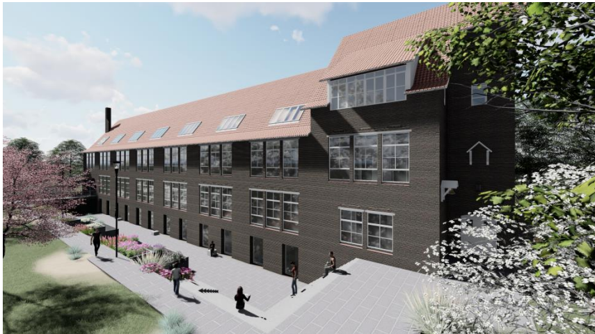
Impressie nieuwe situatie Villanovastraat

De situatie van SLAK in Nijmegen stond in 2017 in het teken van het nieuwe atelierbeleid. In dit nieuwe beleid legt gemeente Nijmegen de focus op doorstroming in ateliers. Hiermee wil de gemeente bewerkstelligen dat ook de jonge, startende kunstenaars eerder een atelierruimte tot hun beschikking krijgen. In samenwerking met de afdeling Cultuur van gemeente Nijmegen onderzocht SLAK de mogelijkheden om de doorstroming in de sector te bevorderen. Het plan is om gefaseerd contracten voor periodes van vijf jaar aan te gaan bieden.