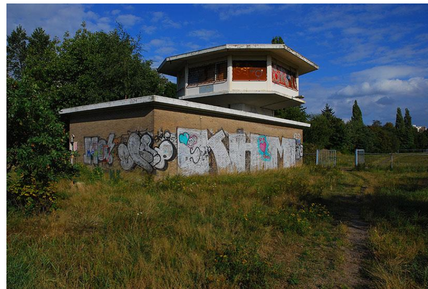
Leegstaande Seinhuis in de spoorkuil bij Bottendaal

is vooralsnog onduidelijkheid over de toekomst van het Seinhuis dan wel de Spoorkuil als geheel. Binnenkort verwacht SLAK meer duidelijkheid. SLAK hoopt vervolgens een cultureel én sociaal initiatief te kunnen huisvesten in dit markante gebouwtje in de spoorkuil van Bottendaal.